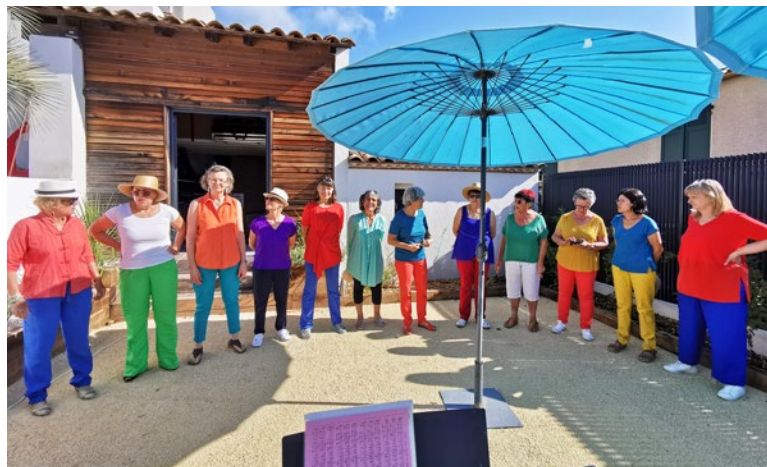
Le chœur de femmes Entr'elles