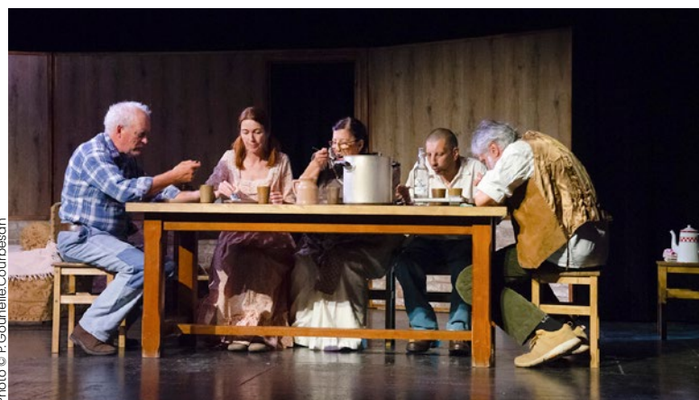
Du vent dans les branches de Sassafras

« Enfin, vous seront proposés comme chaque année trois pièces de théâtre, de courtes lectures poétiques avant chaque pièce, un concert de musique sacrée à l'église et un double concert vocal pour clore le festival, spectacles en grande partie interprétés par des artistes amateurs ».