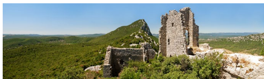
Inscrits aux Monuments historiques en 2022, les châteaux de Montferrand et de Viviouères à Vallfauens figurent en bonne place dans un ouvrage passionnant édité par la DRAC Occitanie intitulé « Du castrum du castelas, châteaux abandonnés du Moyen Âge dans les garrigues et piémonts de l'Hérault » : https://www.calameo.com/read/005375114ce017a9f4a78?page=3 .

Le cahier des charges est le plus exigeant des AOP du Languedoc. « Il inclut notamment des mesures agri-environnementales comme l'interdiction du désherbage ». Une commission sur le changement climatique en collaboration avec la Chambre d'agriculture a d'ailleurs été créée cette année. « Cinq expérimentations sont conduites pour étudier les procédés permettant à la vigne de mieux résister ».